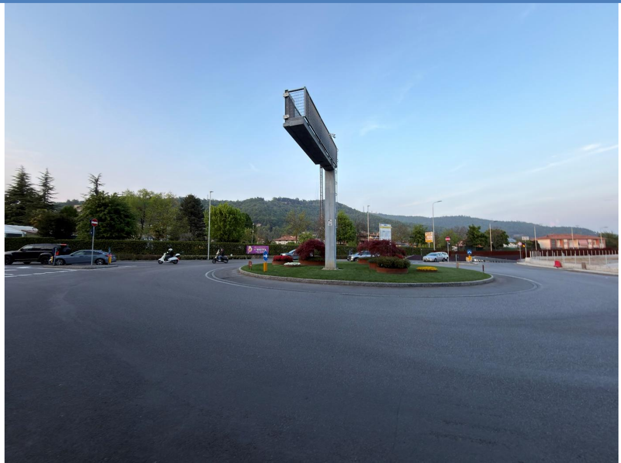
Rotatoria lotto A dopo l'intervento