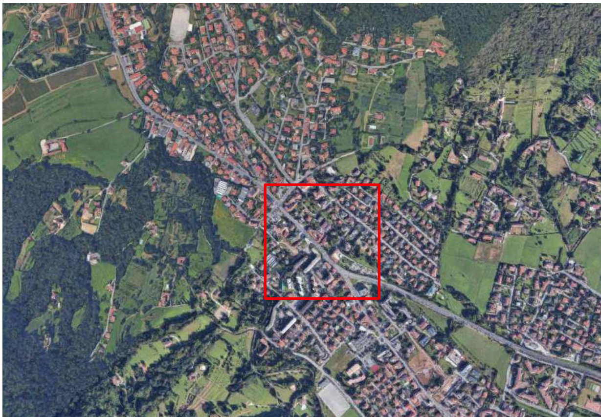
Vista prima dell'intervento

Gli obiettivi conseguiti a fine intervento sono stati: il miglioramento dei flussi circolanti con riduzione dei tempi di attesa e diminuzione degli accodamenti, miglioramento delle condizioni di sicurezza e delle fluidità del traffico delle strade collegate dalle due nuove rotatorie, la messa in sicurezza degli attraversamenti pedonali.