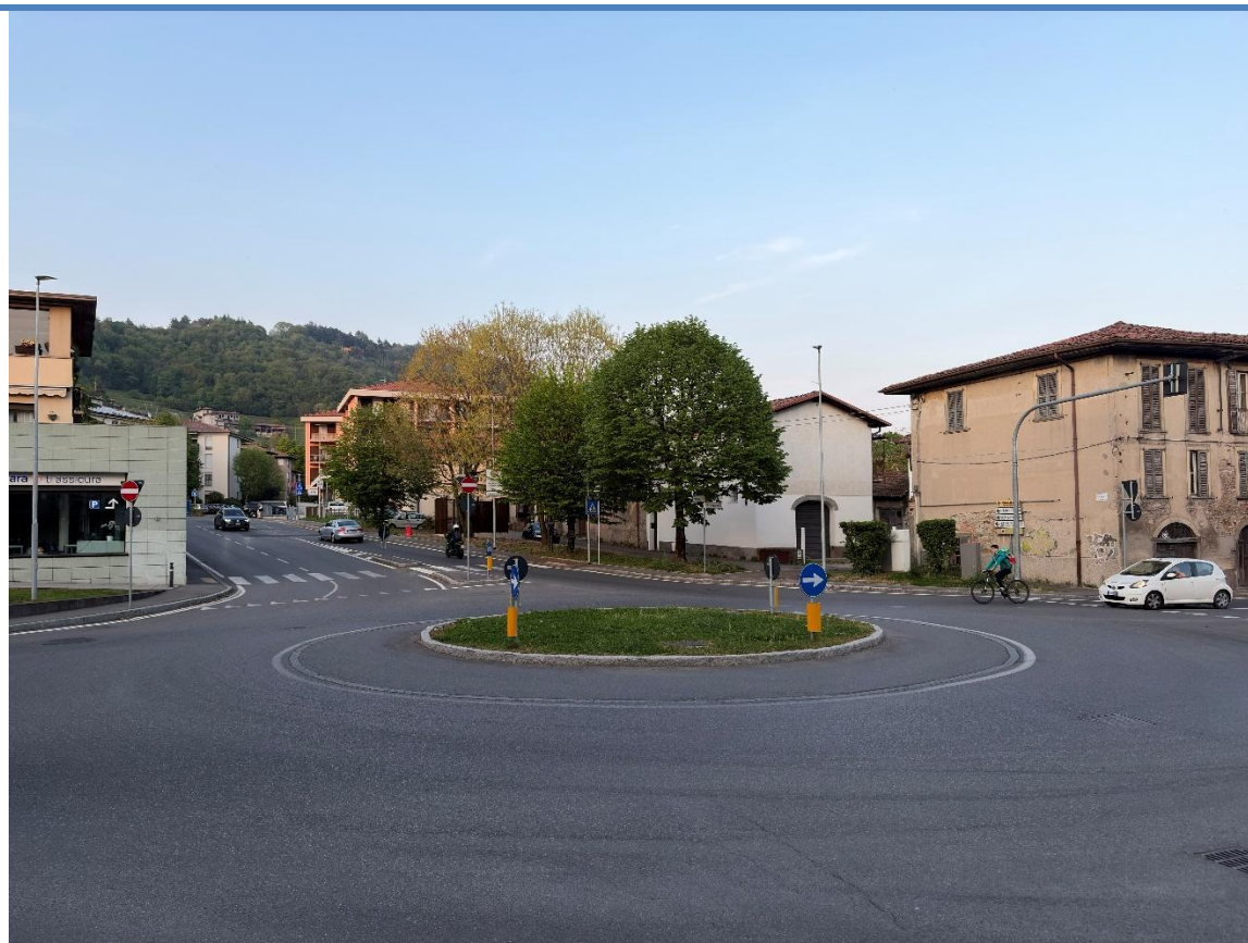
Rotatoria lotto C dopo l'intervento